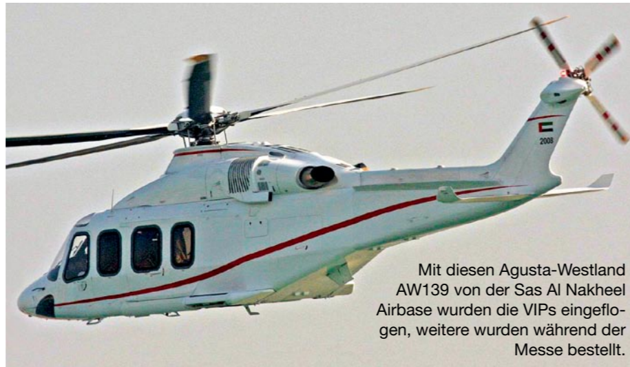
Mit diesen Agusta-Westland AW139 von der Sas Al Nakheel Airbase wurden die VIPs eingeflogen, weitere wurden während der Messe bestellt.

Abgesehen vom in der Region in Kuwait, Saudi-Arabien, Israel und künftig auch in den Emiraten präsenten US-System PATRIOT, gab es in Sachen bodengestützter Luftverteidigung – stets eine der Hauptparten auf der IDEX – diesmal das neue chinesische System «Yitian» von NORINCO zu sehen, einem 8-fach SAM-Starter mit Klappradar und auf WZ551 6 x 6 Fahrgestell. Oder einen neuen Turm mit vier MISTRAL von MBDA-Rheinmetall.